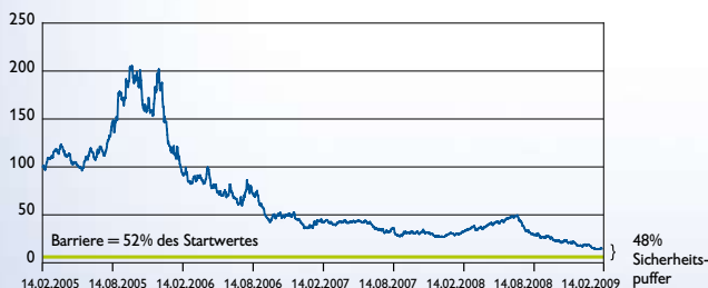
S&P GSCI Natural Gas ER

Erdgas ist eine Sammelbezeichnung für brennbare Naturgase, die im porösen Gestein unterirdischer Lagerstätten vorkommen, häufig gemeinsam mit Erdöl. Erdgas wird als Stadt-, Heiz- und Treibgas verwendet und ist ein wichtiger Rohstoff für die petrochemische Industrie.