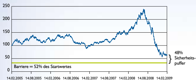
S&P GSCI Brent ER

Brent ist die für Europa wichtigste Rohölsorte. Es stammt aus der Nordsee zwischen den Shetlandinseln und Norwegen.