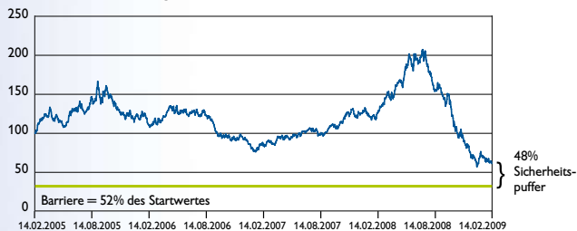
S&P GSCI Heating Oil ER

Heizöl wird aus den schwer entflammaren Anteilen des Erdöls hergestellt. Es ist das zweitwichtigste Raffinerieerzeugnis nach Benzin.